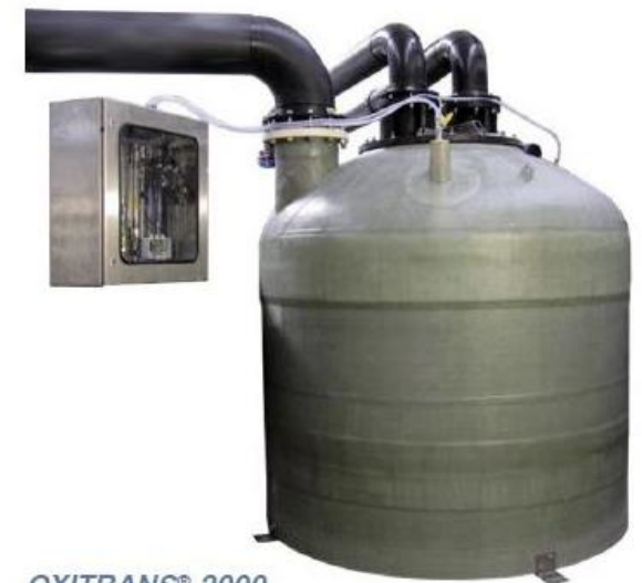
OXITRANS® 2000 mit Sauerstoffdosiereinheit

Wir bieten für jede Anlagengröße die passende OXITRANS® -Größe, um einen effizienten Betrieb zu gewährleisten.